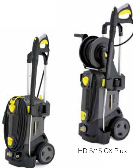
HD 5/15 CX Plus